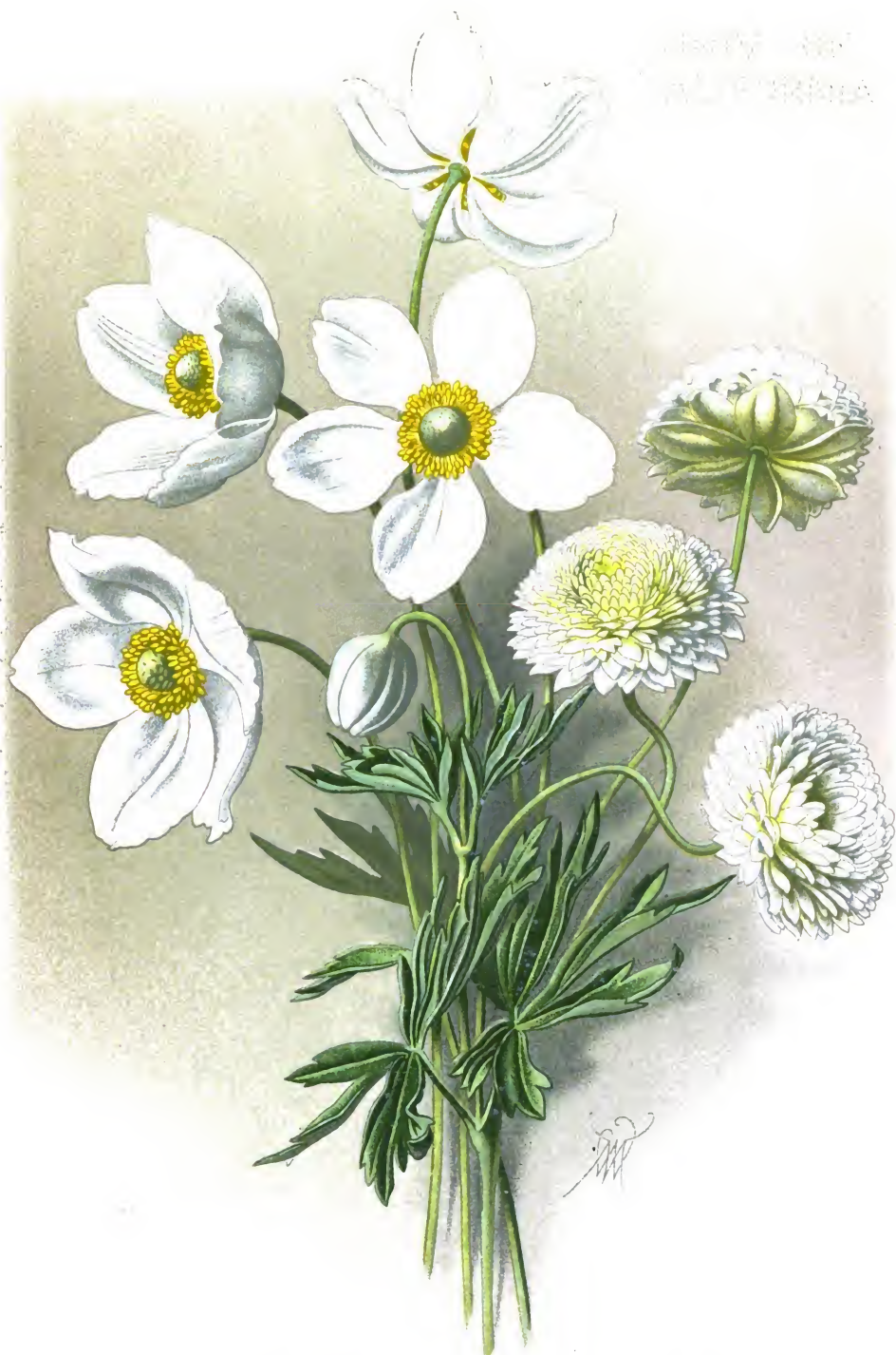
Anemone sylvestris L. var. grandiflora et var. flore pleno .